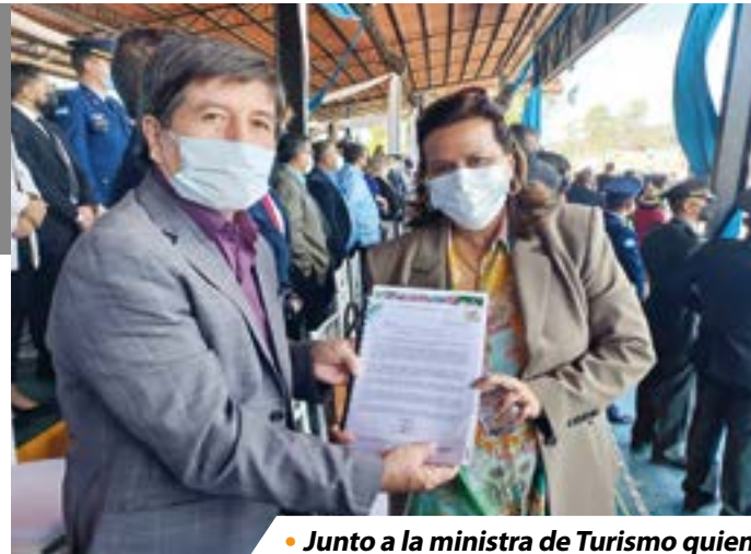
• Junto a la ministra de Turismo quien se comprometió a dar su respaldo.

pasará por Honduras y organizadores esperan apoyo