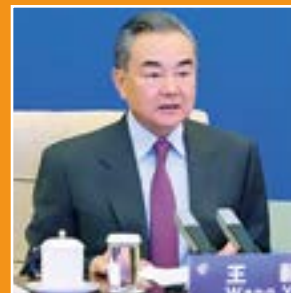
• Wang Yi, consejero de Estado y ministro de Relaciones Exteriores de China.

Tercero, dijo Wang, «China ha estado siguiendo la evolución del asunto ucraniano, y la situación actual es algo que no queremos ver».