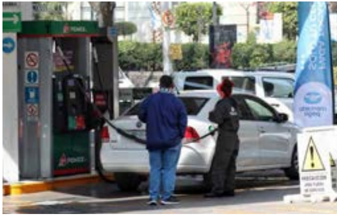
• La rebaja de 10 lempiras que hizo el Congreso no se sintió.

La Secretaría de Energía anunció a través de un comunicado que a partir de este lunes, los precios de los combustibles sufrirán incrementos, especialmente las gasolinas súper y regular que experimentarán ajustes de más de un lempira en todo el territorio hondureño. Las autoridades explicaron que lo anterior se debe al conflicto entre Ucrania y Rusia, la demanda mundial en los últimos meses además del clima que impera en el norte del continente ha creado una