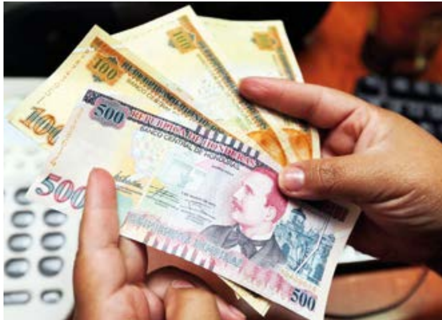
• El aumento debe ser retroactivo desde enero.

De no llegar a un acuerdo, la presidente Xiomara Castro, deberá tomar la decisión y los trabajadores esperan una aumento justo tal y como ha sido la promesa de la gobernante.