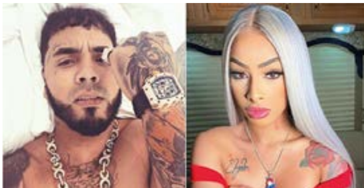
• Anuel ahora está en los brazos de Yailin y así olvida a Karol.

Se olvidó de Anuel AA y ahora amplía su horizonte