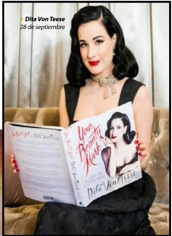
• Dita Von Teese 28 de septiembre