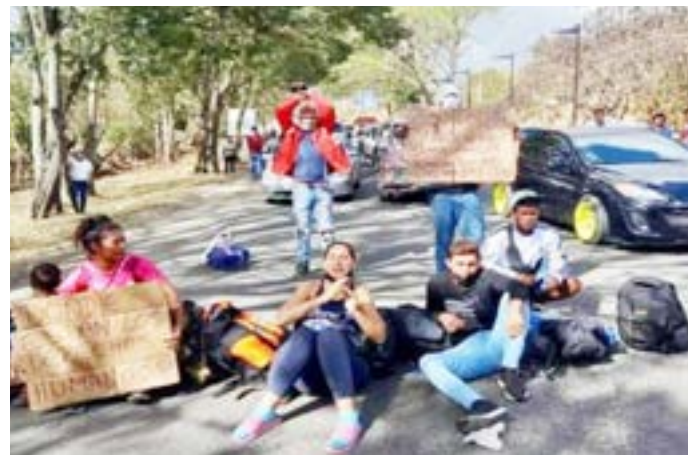
• Las protestas son constantes entre los migrantes de otros países que quieren salir del país.