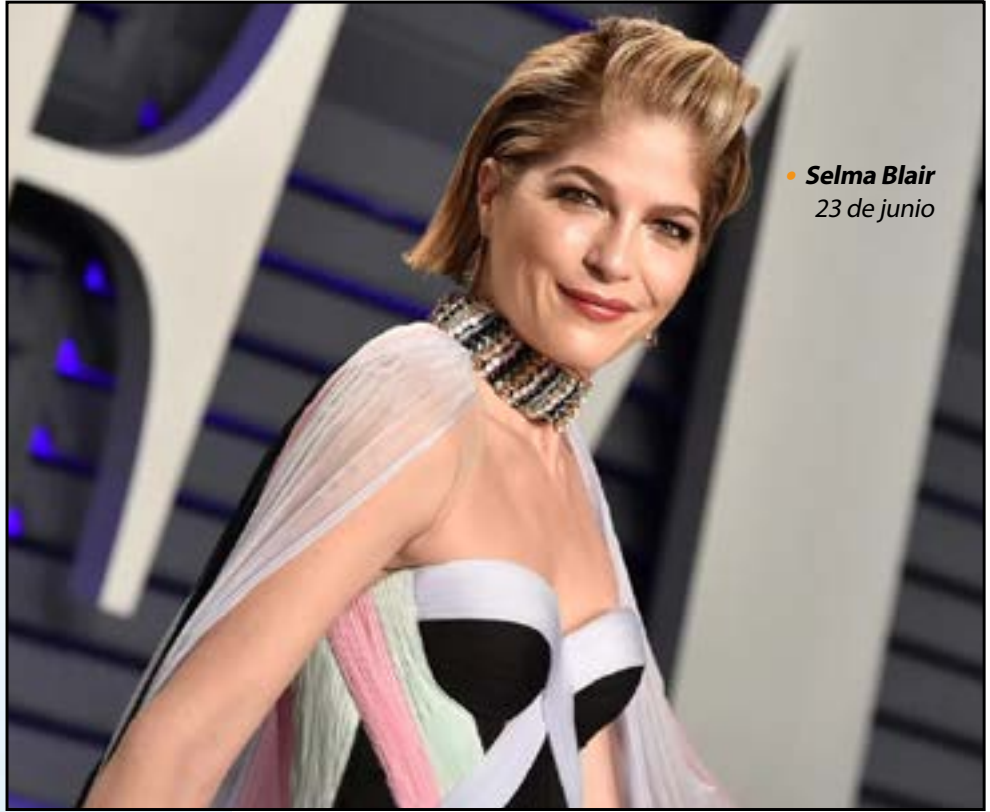
• Selma Blair 23 de junio