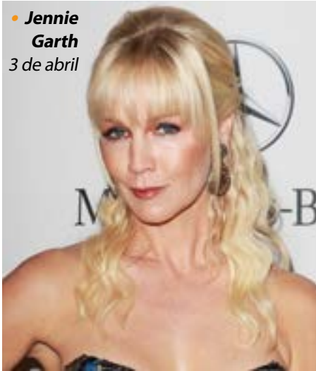
• Jennie Garth 3 de abril