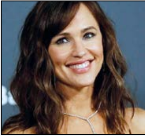
• Jennifer Garner 17 de abril