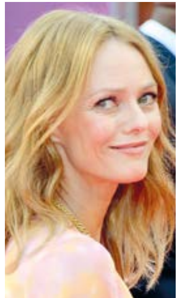
• Vanessa Paradis 22 de diciembre

En algunos casos, su carrera se ha apagado un poco, en otros han tenido un resurgimiento y se han posicionado como grandes estrellas del espectáculo, por lo que se encuentran en su mejor momento. Sea como sea, la realidad es que ninguna de estas 13 mujeres pasa desapercibida. (la-guadelvaron)