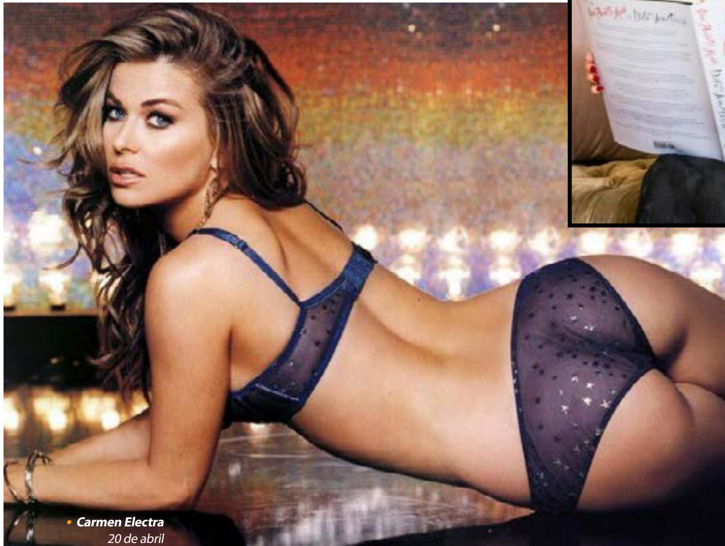
• Carmen Electra 20 de abril