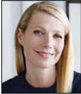
• Gwyneth Paltrow 27 de septiembre