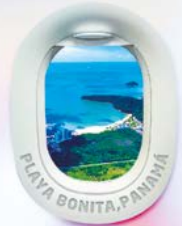
PLAYA BONITA, PANAMÁ