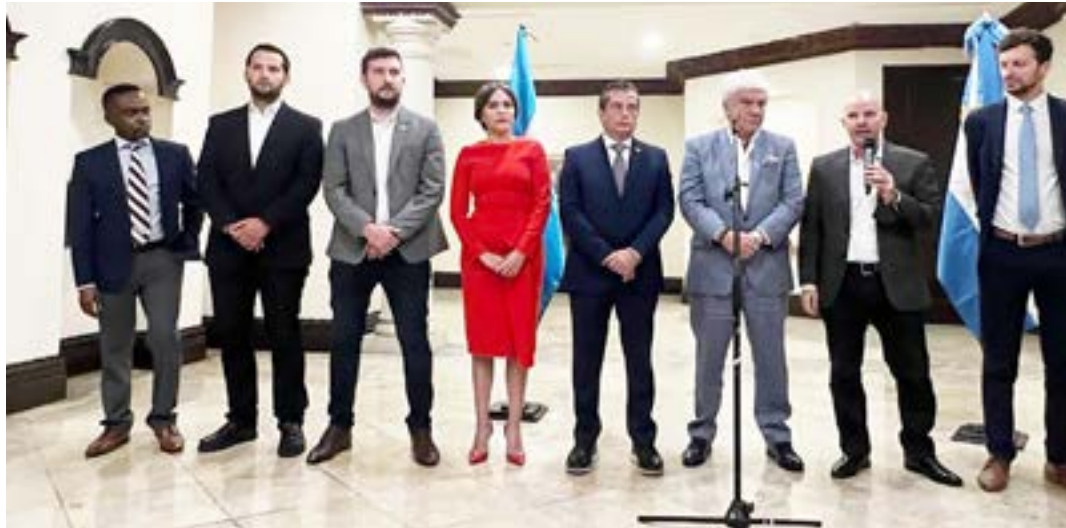
• La Delegación Empresarial Argentina arribó con 22 empresarios y funcionarios de la Cancillería y del Ministerio de Producción.

Asimismo, dicha Delegación mantuvo encuentros con au-