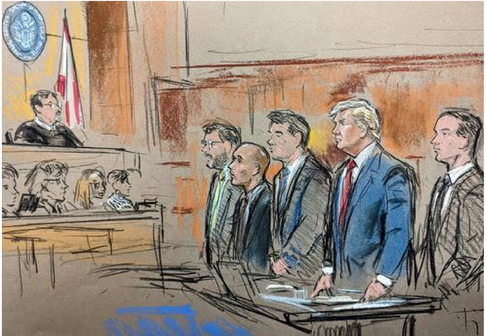
● Trump ante un juez federal en Miami, el 13 de junio. (Dibujo CBS NEWS-MIAMI).

te Trump quien la nomino para el delicado cargo que ella actualmente ocupa. Pero hoy en día, en el mundo político y jurídico que estamos viviendo eso de recurrirse parece haber pasado al cesto del olvido en el congreso, el poder ejecutivo, en las gobernaturas, en la Corte Suprema de Justicia y en otras cortes federales y estatales.