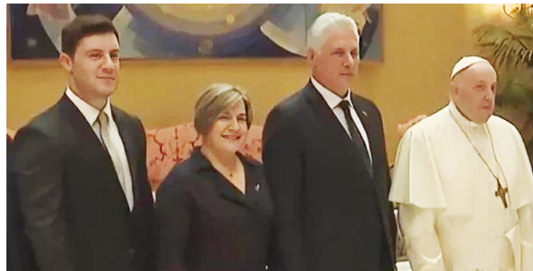
• El Papa Francisco recibe en el Vaticano al presidente de Cuba, Miguel Díaz-Canel, su esposa, Lis Cuesta y a su hijo mayor Miguel Díaz-Canel Villanueva. (Foto Vaticano Media).

Por el contrario, ningún dirigente del resto de los cuatro países centroamericanos ha denunciado